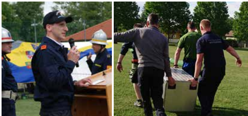
Gute Planung und viele helfende Hände waren für die erfolgreiche Veranstaltung der Bewerbe in Wienerherberg notwendig.

Ganz abgesehen von den Hürden, die eine Pandemie so mit sich bringt, ist die größte Herausforderung bei der Organisation eines Festes in dieser Größenlage das Personal. Bei der Austragung eines Bewerbs im Zuge eines parallel laufenden Feuerwehrheurigen werden viele zusätzliche Helfer benötigt. Als Freiwillige Feuerwehr mit 46 Mitgliedern kann man hier schnell an seine Grenzen stoßen. Umso dankbarer waren wir für die große Unterstützung aus der Bevölkerung.